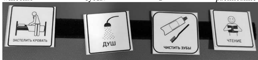
Рис.2 Расписание дня с карточкой «Чистить зубы»